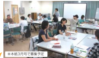
※本紙3月号で募集予定

仲間をつくり、みんなが参加したくなるような魅力ある講座の企画・運営のノウハウについて学ぶ場です。修了後は学びを生かし、地域で講座を企画・運営することもできます！