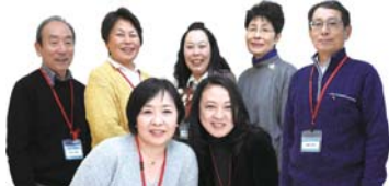
アワーズ スタッフの皆さん