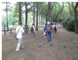
▲ウォーキング、健康づくりに関する研修などを企画・開催します