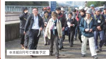
※本紙8月号で募集予定

「保土ヶ谷のまちを知りたい」、「地域で何かを始めたい」、そんなあなたのための講座です。保土ヶ谷のまちを歩いて、農や食、歴史や自然などの魅力と一緒に探しに行きましょう。