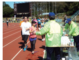
▲マラソン大会、球技大会などのスポーツイベントを企画・運営します

保健活動推進員とスポーツ推進委員は、自治会町内会を通じて推薦いただけます。ご興味がある方は、お住まいの自治会町内会にご相談ください。