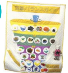
▲ヘルスマイト手作りの食事バランスガイドタペストリー

「食生活等改善推進員養成セミナー」を受講修了後、ヘルスマイトとして活動することができます。「自分の健康が気になる」「健康づくりと料理に関心がある」「ボランティア活動をやってみたい」、そんな方はぜひご応募ください!