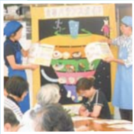
▲町内会からの依頼講座

地域の食文化を大切に、小学校での食育活動や町内会・地域ケアプラザなどで活動を行っています!