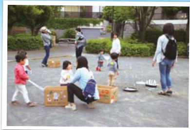
岡区役所こども家庭係 ☎334-6323 📠333-6309

「この公園に行ったら、知っている人がいる」「公園で、ちょっと子育ての相談をしてみよう」など、身近な公園が地域での育児交流・多世代交流の場になるよう取り組んでいます。ぜひ、遊びに来てください。