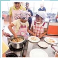
▲小学生を対象にしたキッズ料理教室