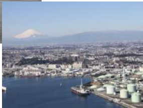
一大工業地帯が出現