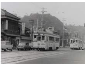
市電白旗停留所付近（昭和42年）