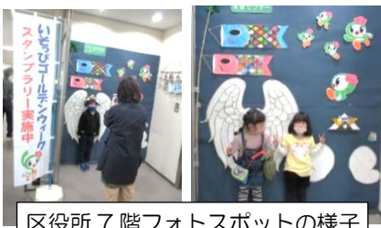
区役所 7 階 フォトスポットの様子

今年から支援センターに勤務し初めてのいそつなゴールデンウィークでした。フォトスポットに楽しく参加していただけるように 50 年前を思い出してカブトを折ってみました。