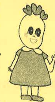
イメージキャラクター ささげちゃん