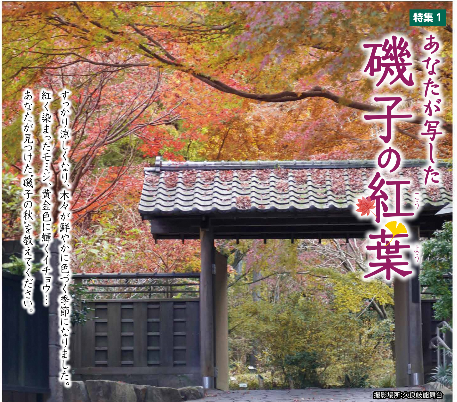
撮影場所:久良岐能舞台

すっかり涼しくなり、木々が鮮やかに色づく季節になりました。 美しく染まったモミジ、黄金色に輝くイチョウ… あなたが写した「磯子の秋」を教えてください。