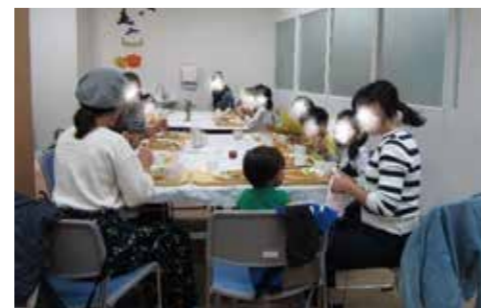
杉田地区 子ども食堂キッチンうめちゃん