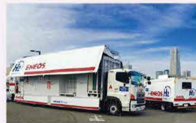
移動式水素ステーション(大さん橋)

水素は、利用段階でCO 2 を排出せず、製造段階でも再生可能エネルギーを用いたCO 2 フリー水素の生産が可能です。当社グループでは、水素を燃料とする燃料電池車の普及を見据えた水素ステーションの整備など、水素事業の推進に取り組んでいます。