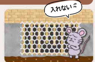
破損した通気口を補修すると

通気口やエアコンの引き込み口、排水管周辺など隙間があれば金たわし、パテや金網などでふさぎましょう。(ネズミは1cm程度の隙間があれば侵入することができます。)