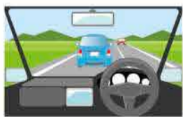
交通安全シミュレーター体験

各商店街からの豪華景品が当たる抽選会や、オリジナル缶バッジ・似顔絵のプレゼント、交通安全シミュレーター体験など、イベントも盛りだくさんです。みなさんぜひご来場ください!