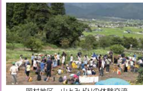
岡村地区 山とみどりの体験交流 (長野県池田町との児童相互交流)