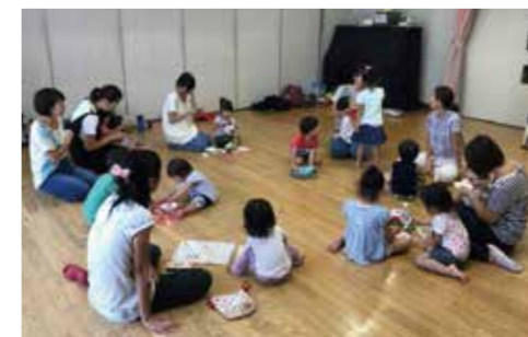
洋光台地区 わんわんくらぶ(子育てサークル)