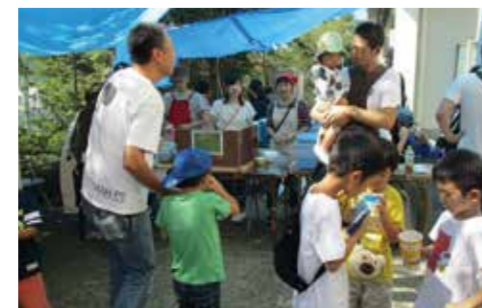
汐見台地区 エコパトロール