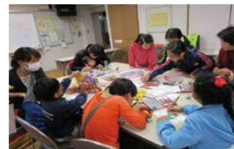
根岸地区 ねぎ子どもとまり木会(子どもの居場所)

地域ではこんな取組をしています! 子ども・子育てに関する地区の取組を SNSで紹介しています!