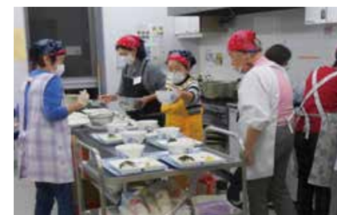
磯子地区 子ども食堂プラザ de ごはん