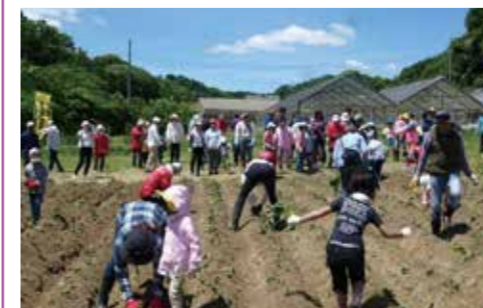
上笹下地区 土のふれあい