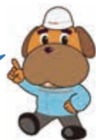
消防局マスコット ハマくん

なお、状況や症状からみて緊急だと感じたら、迷わずすぐに119番通報してください。