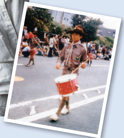
横浜市のパレードにボーイスカウトの鼓笛隊として参加(小学6年生)