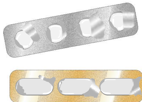
薬（飲み薬錠剤）の個別包装ケース