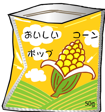
お菓子の袋（プラスチック製）