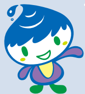
泉区マスコットキャラクター いっすん