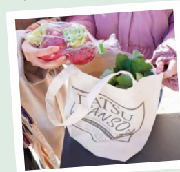
荷物は エコバッグへ♪

よこはま地産地消サポート店* のお店でちょっと休憩。 地元食材は車の運搬距離が 短いので、CO2の排出が 抑えられます！