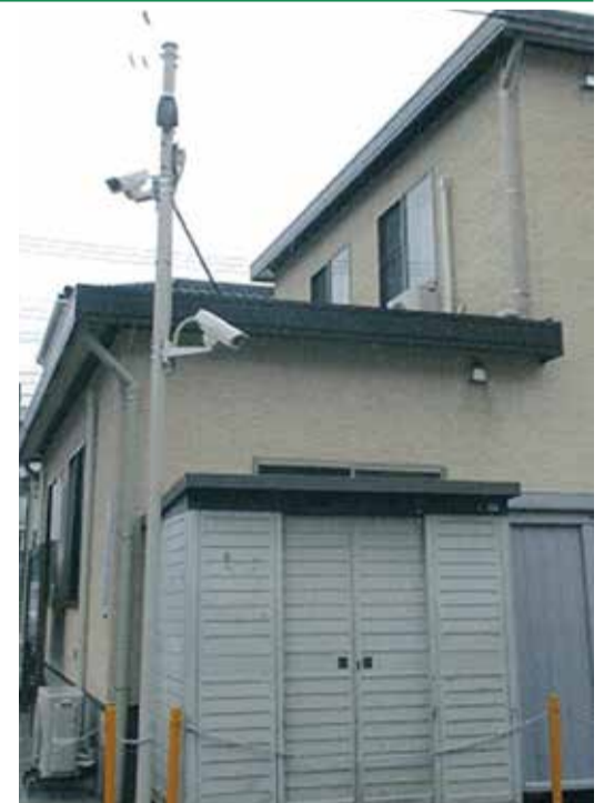
自治会館に設置した防犯カメラで地域の犯罪を抑止