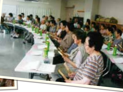
▲高齢者を対象とした「地域の集い」