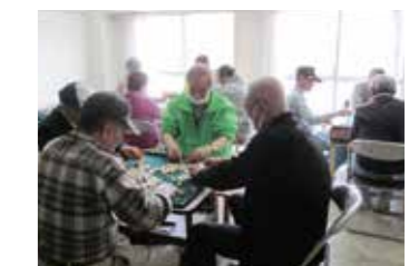
楽しみにしている健康マージャン