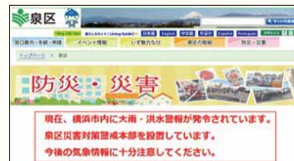
泉区ホームページ「防災・災害のページ」

大雨や強風などによって災害が起こるおそれのあるときは「注意報」を、重大な災害が起こるおそれのあるときは「警報」を、重大な災害が起こるおそれが著しく大きいときは「特別警報」を気象庁が発表して注意や警戒を呼びかけます。