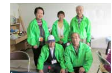
ボランティアメンバーのみなさん