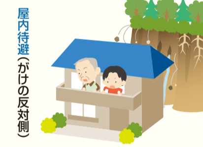
屋内待避(かけの反対側)

夜間や危険が差し迫っている場合など、屋外へ避難するとかえって危険な場合は屋内の安全な場所(かけの反対側の高い位置)へ避難しましょう。