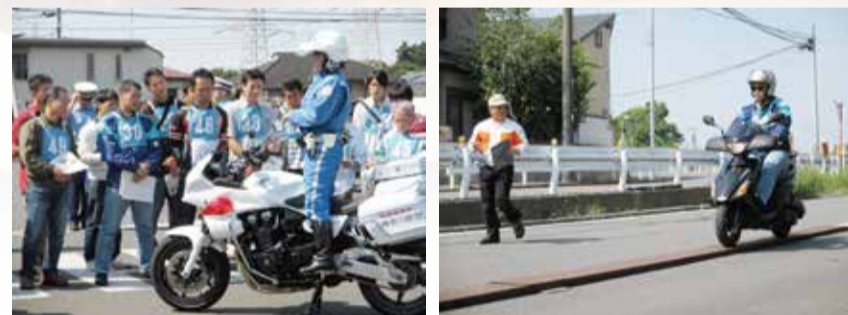
昨年の「二輪車講習会・競技会」の様子

日時: 10月24日(土) 13時から 場所: 戸塚自動車学校(泉区新橋町) 申込み: 9月30日までに問合せ先へ 問合せ: 泉警察署交通課交通総務係 ☎・☎805-0110