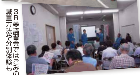
3R夢講習会ではごみの減量方法や分別体験も

これからも、スポーツや健康づくりを通して、住民の連帯感を強め、よりいっそうきれいで住みよいまちづくりに取り組んでいきます。