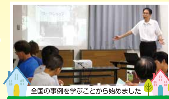
全国の事例を学ぶことから始めました