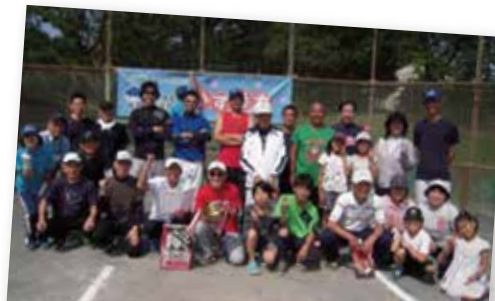
熱戦を終えて笑顔で集合する優勝チーム

毎年6月に行われる連合主催の「ソフトボール大会」は大きな行事の一つです。今年もスポーツ推進委員や青少年指導員が中心となって運営し、9チームが熱戦を繰り広げ、親睦を深めました。