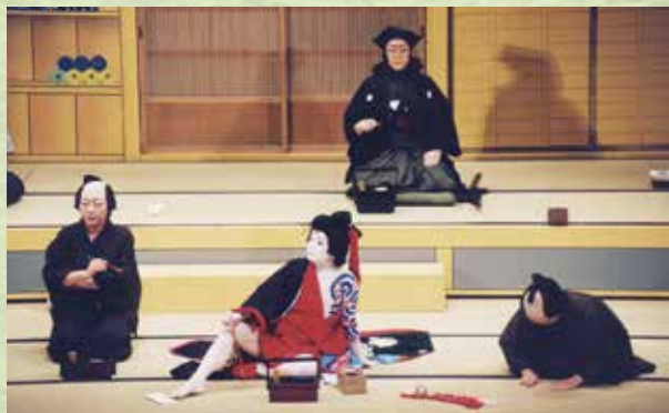
第5回公演「弁天娘女男白浪 浜松屋見世先の場」