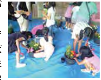
子どもたちの花鉢作り

花鉢を玄関先に置くこの取組は、子どもの見守りだけでなく、子どもと大人、さらに近所同士で気軽にあいさつなどを交わすきっかけにもなり、地域のつながりづくりに一役買っています。