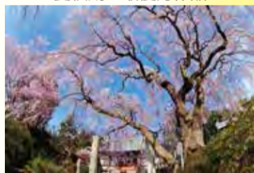
冬春期の最優秀作品