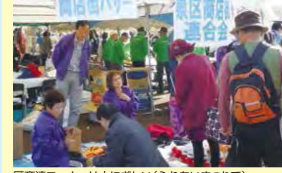
区商連コーナーは大にぎわい(ふれあいまつり)で