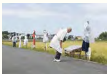
夏秋期の最優秀作品