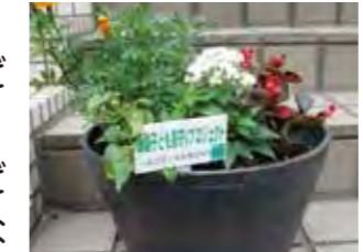
玄関に置かれた花鉢は地域のつながりづくりに