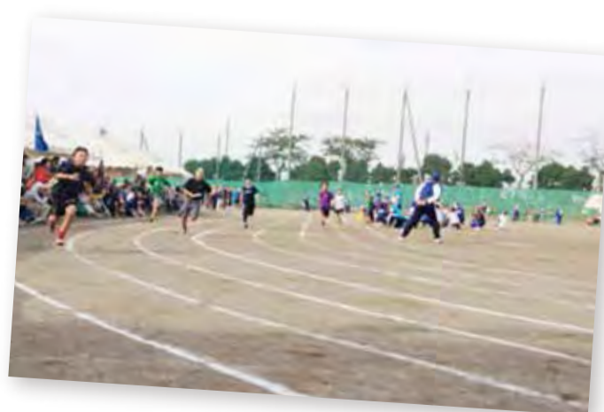
昨年行われた連合自治会体育祭の様子

泉区役所 〒245-0016 和泉町4636-2 ☎800-2323(代表番号) fax800-2506