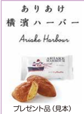
プレゼント品(見本)

1月31日(当日消印有効)までに、、、、年代、及び「30周年記念プレゼント希望」と書いて、はがきかFAXか広報相談係(区役所1階101窓口)へ ※いただいた個人情報は当コーナー以外の目的で使用しません。 ※当選者の発表は賞品の発送をもってかえさせていただきます。