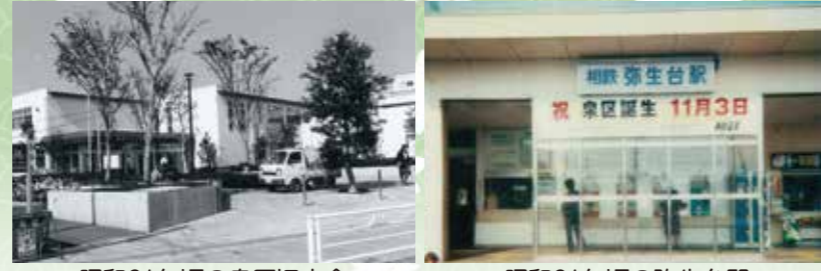
昭和61年頃の泉区旧庁舎 昭和61年頃の弥生台駅