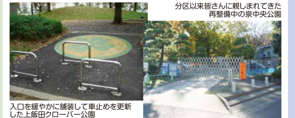
分区以来皆さんに親しまれてきた再整備中の泉中央公園

工事期間中はご不便をおかけしますが、安全で安心な公園にするため、ご理解、ご協力くださいますようお願いいたします。