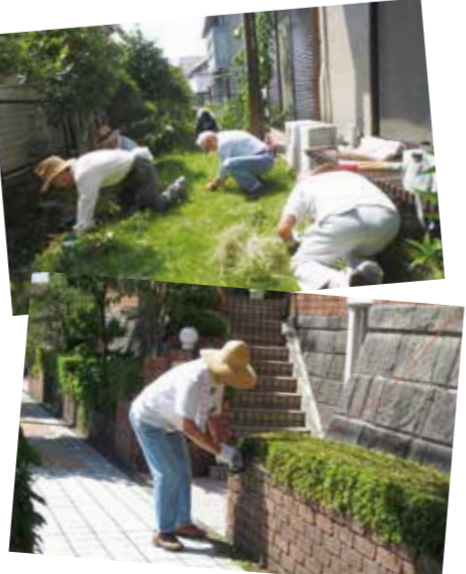
草取りをしているライフサポート隊