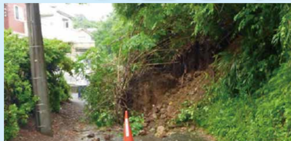
区内で発生した崖崩れ

大地震は突然やってきます。また、おととしの台風18号では区内でも床上浸水や崖崩れ、道路冠水が発生しています。いざという時に困らないよう、日頃から避難場所や避難経路の安全などを確認しましょう。