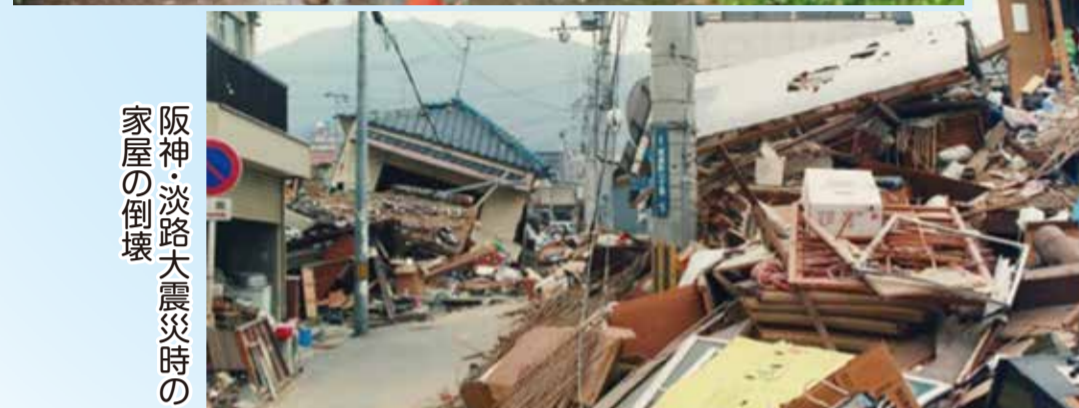
阪神・淡路大震災時の家屋の倒壊