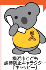
横浜市こども虐待防止キャラクター「キッピー」