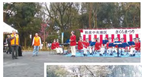
泉中央公園リニューアルオープンの時には多くの人たちでにぎわいました。