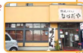
「讃岐うどん なかだ」の看板が目印です

<施設から> 毎日、国産小麦100パーセントで心を込めて製麺しています! 本格的な讃岐うどんをぜひご賞味ください!!