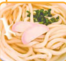
こしが自慢のうどん 日替わりやセットメニューもあります

住所 和泉中央北3-6-5 ☎802-5112 ☎802-5190 営業時間 11時30分～15時(金曜日は14時まで) 定休日 土、日、祝日 (第5土曜日営業有) 交通 相鉄いずみ野線いずみ中央駅下車、徒歩10分