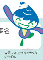
泉区マスコットキャラクター「いっすん」