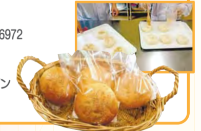
限定の手作りパン コーヒーと一緒にどうぞ

住所 中田北3-6-55 ☎804-6932 ☎804-6972 営業時間 11時～15時30分 定休日 土、日、祝日 交通 市営地下鉄ブルーライン 中田駅下車、徒歩12分