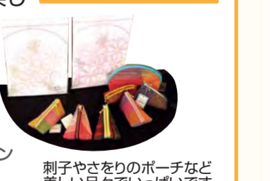
刺子やさわりのポーチなど美しい品々でいっぱいです