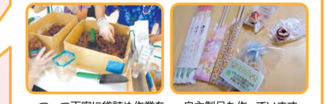
一つ一つ丁寧に袋詰め作業をしています 自主製品も作っています