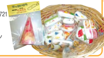
色とりどりのキャンドルとデコパージュせっけん 人気の製品です

住所 和泉中央北1-13-18 ☎800-0720 ☎800-0721 営業時間 9時45分～16時 定休日 土、日、祝日 交通 市営地下鉄ブルーライン 立場駅下車、徒歩10分