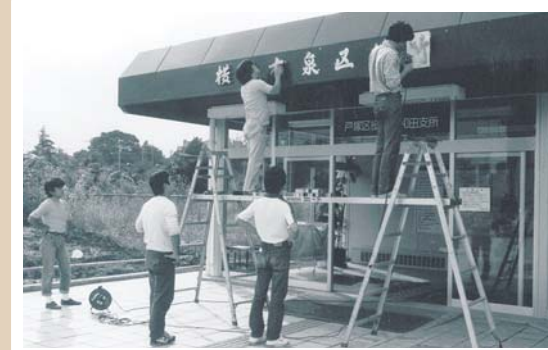
泉区役所(昭和61年撮影) 戸塚区からの区分に伴い、戸塚区中和田支所から泉区役所へ看板を掛けかえています。