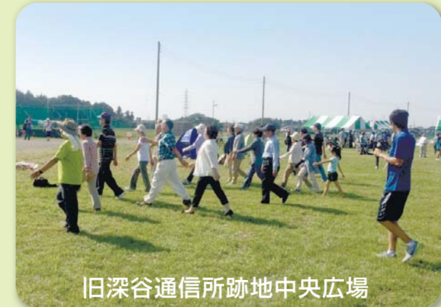
旧深谷通信所跡地中央広場