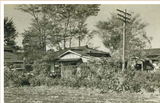
現立場交差点付近(昭和33年撮影) 農地の中に住宅が点在していました。