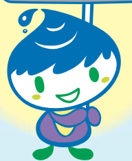
泉区マスコットキャラクター いっずん