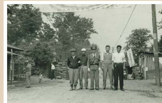
長後街道・現中田小入口付近(昭和30年代頃撮影) 戸塚交通安全協会中和田支部による全国交通安全運動が実施されていました。