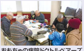
おもちゃの病院ドクトルヘアース