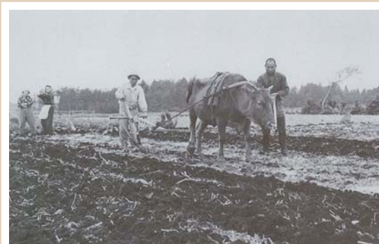
現中和田南小付近(昭和23年頃撮影) まだ耕運機がなく、牛で畑を耕していました。

古くは、鎌倉郡の中川村と中和田村と呼ばれていた今の泉区にあたる区域が、横浜市へ編入されたのは昭和14年でした。その後、昭和61年11月3日に戸塚区から区分し、泉区が誕生しました。写真を通じて、泉区の変遷の一部をご覧ください。