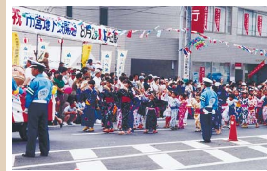
市営地下鉄中田駅周辺(平成11年撮影) 戸塚駅-湘南台駅間の開通を記念するイベントが開催されました。

この他にも、区民の皆さまからご提供いただいた写真と区役所が所蔵する昔の写真、泉区ホームページで公開しています。また昔の写真を使用したパネル(A2サイズ14枚)の貸出しを行っています。詳細はお問合せください。