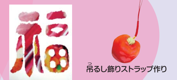
新聞紙をちぎってはがき作り