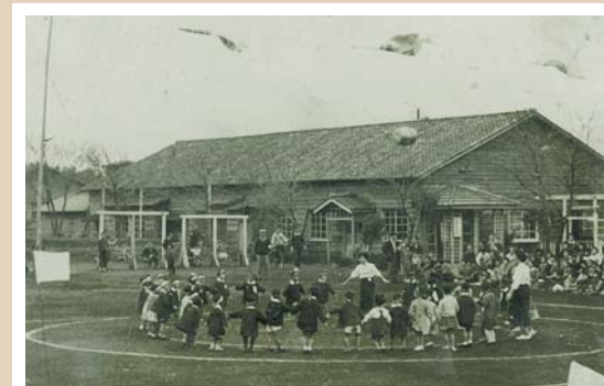
白百合愛児園(昭和20から30年代頃撮影) 中田東にある保育所、白百合愛児園は昭和23年に開設されました。