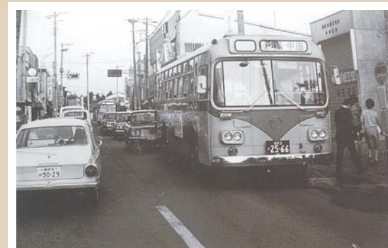
長後街道・現中田駅付近(昭和41年頃撮影) ワンマンバスがバス停で止まり渋滞しています。