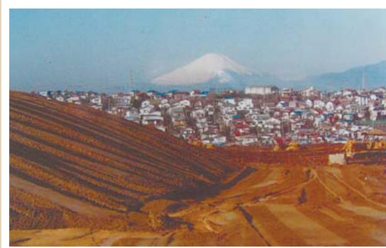
現領家地区(昭和59年頃撮影) 大規模な宅地造成が行われました。(左白百合、右領家)