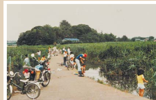
現和泉遊水地(昭和45年頃撮影) 昭和50から60年代にかけて整備され、平常時はスポーツ広場などとしても利用されています。