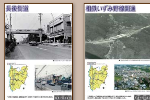
パネルの一例です。