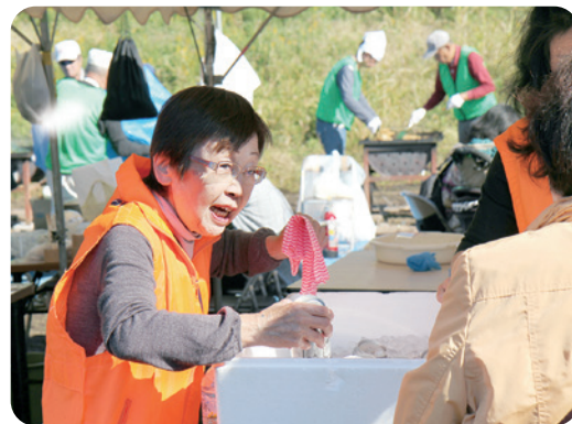
ふれあいまつりでは飲み物の販売担当も

自治会町内会活動に携わる人が減ってきていると感じることがあります。私が始めたころは、当たり前のように地域活動を行っていましたが、今は共働き世帯も増えるなど社会情勢も変わってきており、自治会の活動に時間を割くことが難しくなっているのかなと思います。いずれ役員を交代するときは混乱が起きないように、自分の仕事を次の世代の方に徐々に伝えていきたいと思います。