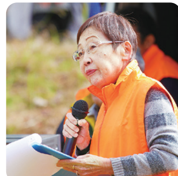
ふるさとまつりでの司会進行

家事などが終わった後の夜間に資料作成をするなどして、時間のやりくりをしています。家族の理解と協力もありますし、何といても連合役員の皆さんは気心が知れていてメンバー同士で、チームワークも良くお互いの役割分担をしながらやっていますので、大変なことがあっても何とか乗り切っています。