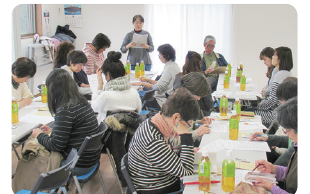
会館管理部とコンシェルジュの打合せ

現在、会館管理は管理部の8人とコンシェルジュの15人で担当しています。ひと月に何回も当番をお願いしているメンバーもいる状態を改善するため、協力していただける方を増やすことが当面の目標です。また、会館を皆さんにもっと知っていただくために3月18日に「会館オープン1周年記念」として楽しいイベントを企画しています。