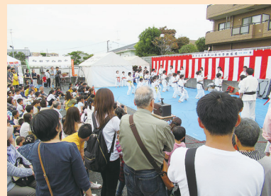
中田ふれあい祭り

10月15日に「立場中央商店会」にて予定していましたが、残念ながら雨天のため中止となりました。