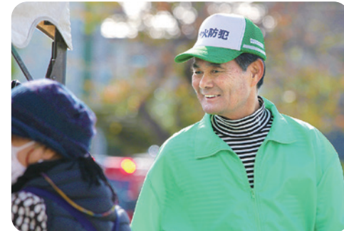
優しいまなざしで地域の人たちを見守る

平成25年までは、連合自治会で500人規模の防災訓練を行っていましたが、各地域の実情に即した訓練を実施してもらうため、発展的に解消し、地域防災拠点を中心とした訓練に移りました。各防災拠点では運営委員長を中心に訓練が行われ、訓練参加者も増加傾向にあり、地域によっては夜間を想定した夜間訓練なども行われています。また家庭防災員は、平成24年度から委嘱制度から研修制度に変わり、組織としての活動が難しくなりましたが、連合自治会で支援することにしました。家庭防災員の積極的な活動により年1回「家庭防災員だより」を発行しています。