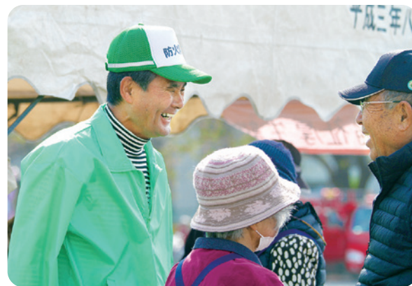
中田文化祭では来場者との会話も弾む

昨年は中田連合自治会創立50周年の節目の年を迎えました。式典の準備や記念誌の発行など、多忙な日々を送りましたが、大変良い経験をさせていただきました。