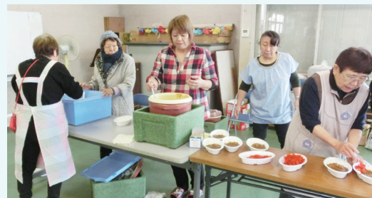
お楽しみ会の昼食を賄うスタッフの皆さん

保護者の皆さんは我が子がみんなと仲良く遊ぶ姿を見て安心していています。多様な文化背景を持った人たちが個性を出し合う楽しいまちづくりをめざす「多文化まちづくり工房」の皆さんには、子どもたちへのサポートをしていただいています。そして、いちよう団地では成長した青少年が団地の多言語による有線放送のアナウンサーを務めています。