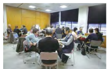
頭と指を使って、楽しく、健康に

開催は月曜日と木曜日の週2回、午前9時～12時、午後は12時50分～15時50分です。地域は新橋町に限定せず、近隣地域や新橋ホームの方も参加しています。参加費は自動卓のメンテナンス費用として10月から1回100円を徴収しました。会員登録者は70人、初心者コースには89歳の女性、ゲームには93歳の女性も参加しています。毎月、上位3人と下位2人および特別賞を100円ショップの商品で表彰しています。参加の励みにもなっているようです。