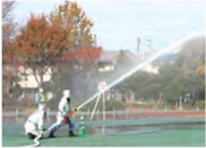
▲大規模災害対応 総合訓練に参加