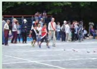
子どもたち参加のチームが3位に入賞する大健闘！

そのような中、市推進のヨコハマさわやかスポーツを取り入れ、幅広い年齢層が参加できるスポーツを目指し、いろいろな取組をしてきました。その