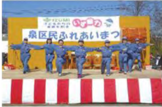
▲防災についてのPR活動も 泉区民ふれあいまつりで J(自助)K(共助)G(減災)体操