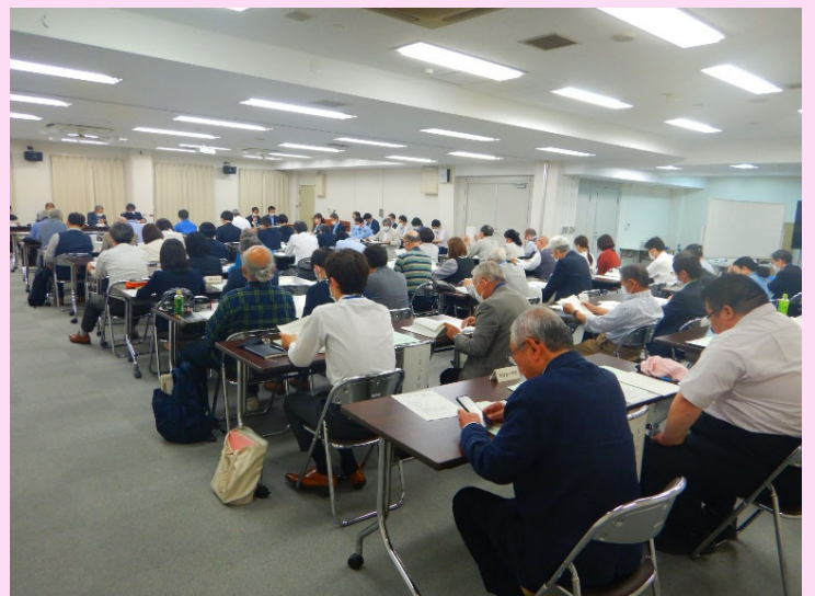
令和5年度 地域防災拠点運営委員会連絡協議会総会の様子

各地域防災拠点運営委員長、各学校長、参加（区役所）が一堂に会する、年に一度の機会となりますので、ぜひご出席をお願いいたします！