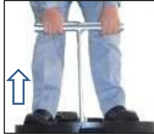
貯留弁引き上げ状況

貯留弁用開閉治具を使用することで、立ったまま取っ手を引き上げることができ、開閉治具の穴にストッパーを差し込むことで、汚水がすべて流れきるまで弁が開いている状態を維持することができるため、排水作業の容易性の向上が図られます。