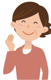
地区全体のまとめ役(…民生委員、自治会など)

地区の情報交換会によると、 地区全体で日中ひとりの 高齢者の人数が増えている みたいだわ。 ⇒これからは、日中ひとりの 高齢者を重点的に見守ろうか！