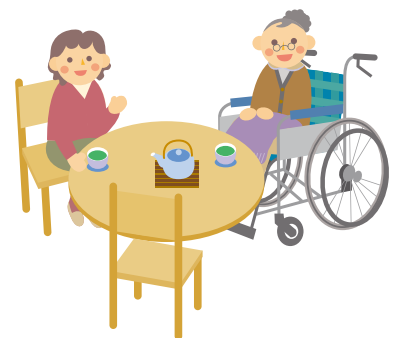
活動単位 (例) 自治会・班・組・隣近所(向こう三軒両隣)など