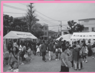
地域交流まつりの様子

住民同士のつながりを広め、さらに深めるために、行事の中身を見直し充実させると共に仲間として参加しやすい環境作りを目指します