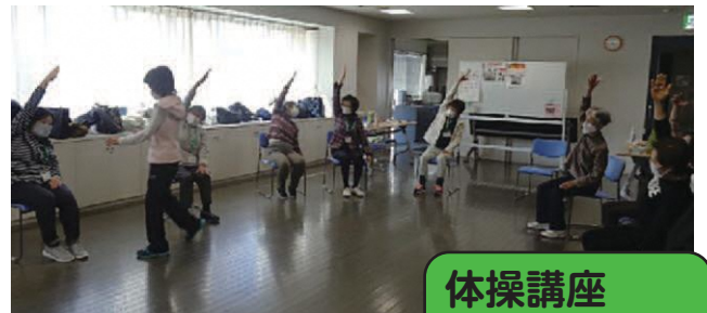
体操講座 @片倉地区

コロナで活動できない地区も多いですが、感染対策をしながら活動を始めている地区もあります！