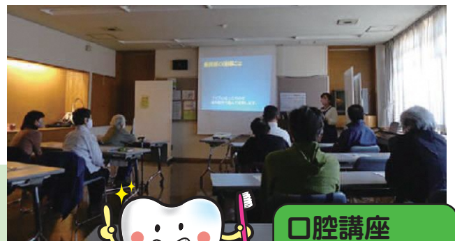
口腔講座 @神奈川地区

コロナで活動できない地区も多いですが、感染対策をしながら活動を始めている地区もあります！