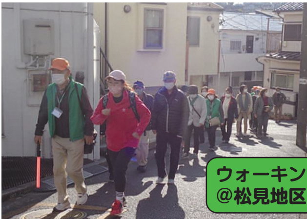
ウォーキング @松見地区