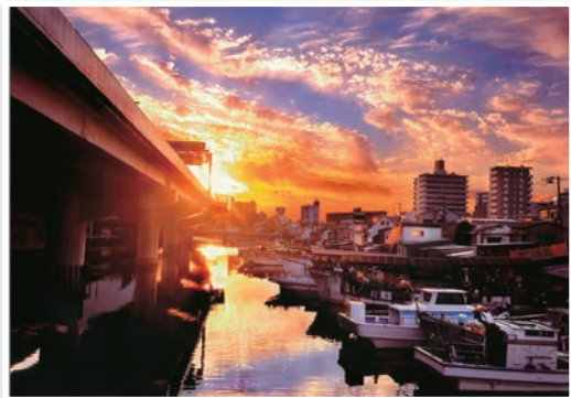
↑第5回「わが町 かながわ とっておき」写真コンテスト入選作品です。

京急「子安」駅から徒歩5分くらいのところにある、首都高速 横須線と国道15号線に挟まれた入江川河口付近は子安浜 と呼ばれ、昔ながらの漁師まちの風景を残しています。