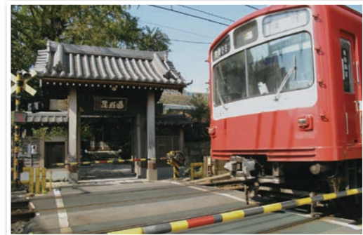
↑第3回「わが町 かながわ とっておき」写真コンテスト入選作品です。

境内を京急本線が走り山門前には踏切があるため「踏切 寺」とも呼ばれています。山門横には横浜市で名木古木 として指定されている樹齢200年以上のイチヨウの木が あります。