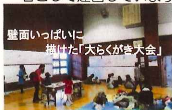
壁面いっぱい描いた「大らくがき大会」

36年前に地区センターのさきがけとして松見地区地域住民のみなさまの要望によって建てられました。今では、横浜市松見集会所運営委員会が指定管理者として運営しています。会議室だけでなく、広い調理室やレクホール、大広間の和室が完備されてます。