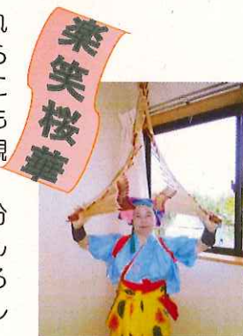
何にも見えるかな～?

あるとき「わたし南京玉すだれをやりたい!」と目覚めてからはや9年。「人前で披露することは、とっても楽しい♪一度もいやだと思ったことがない。観てる人の笑顔から、自分もパワーをもらえる。演技中、自分の思ってもみないところで喜んでくれることが、びっくりするけれど嬉しい。」と笑顔で話してくれました。