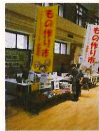
シルバーワークランド 釋楽理庵 神之木工房

来年度のフェスタに出展してみたい方、ステージで披露してみたい方は区民活動支援センターまでご連絡ください。