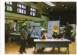
NPO法人神奈川区いまむかしガイドの会 支援センターも出展しました♪