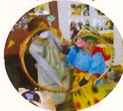
二人で作ったハート

取材に伺った日も皆さんに掛け声をうながし、ノリの良い口上とともに56本の竹が「おながどり」や「富士山」、「ベイブリッジ」などさまざまな形に変化していきます。