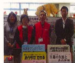
気軽に遊びに来て下さいね♪

自動ドアを入るとすぐ「こんにちは～」と気持ちのよい挨拶がとんできました。館内に入ると広くて明るいロビーが目の前に広がり、スタッフの方が笑顔で出迎えてくれます。大きな窓が多く、太陽の光がいっぱい差し込んでくるのが自慢の一つ。その他にも図書コーナーには新刊が並び、ポップを使って本を探しやすくするように工夫されています。