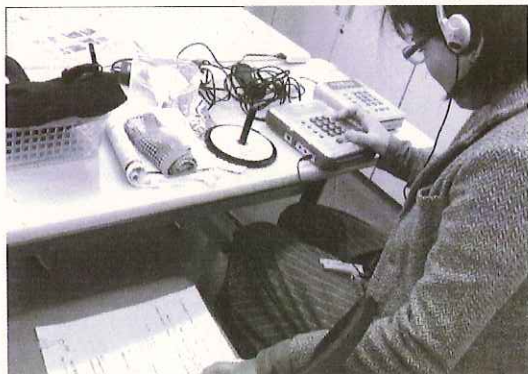
編集集中。原稿を追いながら聴いてボタンを押して。