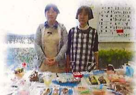
この日は「一の会2(ツ)」