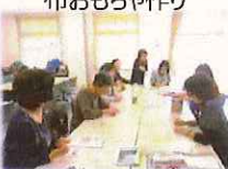
押し花でひなづくり