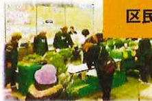
収穫物の展示販売