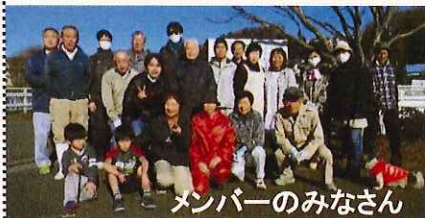
メンバーのみなさん

サポーター募集！！ 活動に興味がある方は 直接、砂田川合流橋 へ来てね！ 毎月第1日曜日 9:00～10:30