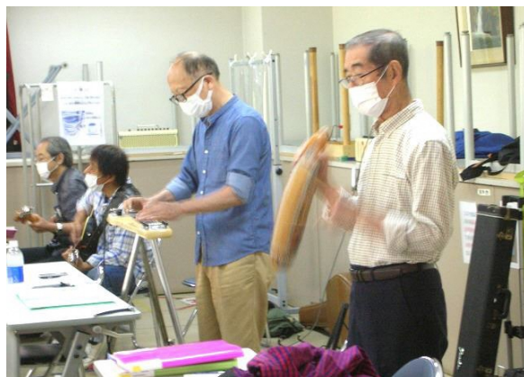
スチールギター（中央）とギロ（手前）

「かながわウカレレおやし〜ず」が発足するきっかけになったのは2017年1月、神奈川県区民活動支援センターが主催したウクレレ講座。講座修了後、「定年後の楽しみを求めて」「新しい仲間と一緒にウクレレグループの設立を目指して」などを謳い文句にメンバーを募集したところ、定年退職した世代を中心に集まりました。現在のメンバーは60代から最高齢90歳まで18人、そのうち半数が講座の受講生で、初心者から数十年にわたってウクレレやギターを弾いてきたプロ級の男性もいます。