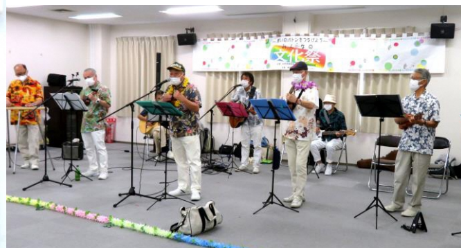
「みんなの文化祭」で発表