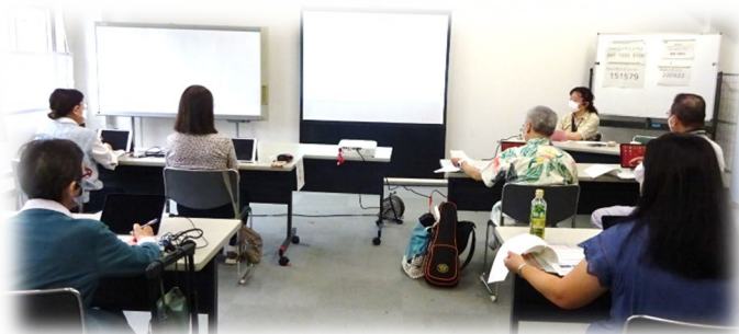
Zoomの活用について話を聴く参加者のみなさん

区民活動支援センターの登録に関することは神奈川県役所5階507窓口まで。 お問合せ：045-411-7089