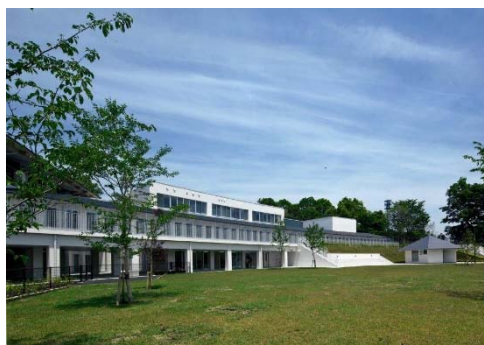
横浜市動物愛護センター (平成 23(2011)年開設)