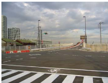
臨港幹線道路(臨港パーク～瑞穂、一部暫定供用)(平成 20(2008)年開通)