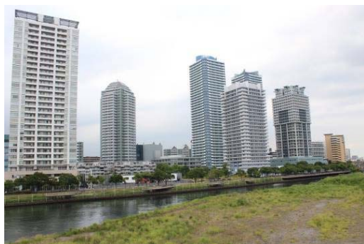
ヨコハマポートサイドF-1街区第一種市街地再開発事業(平成 17(2005)年度完了)