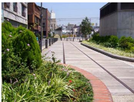
東横フラワー緑道 (平成 23(2011)年開通)