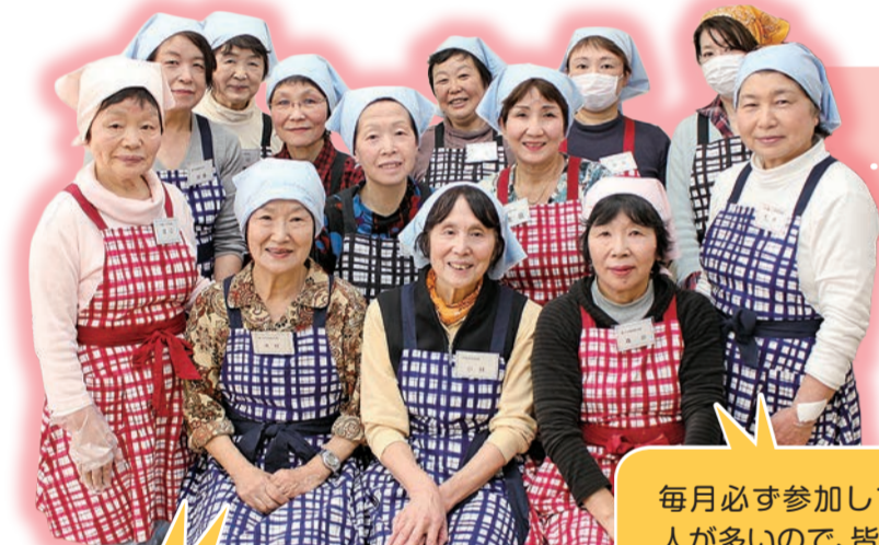
新子安地区民生委員・児童委員とボランティアの皆さん