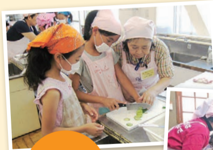
小学校での調理実習