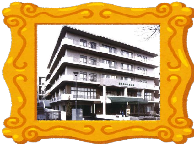
特別養護老人ホーム 能見台ホーム外観

あざらし型介護ロボットはパロってという名前で、 実際にコミュニケーションが取れるんだって！ 可愛いなあ！