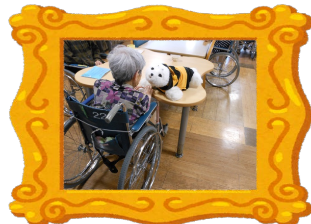
あざらし型介護ロボットと触れ合う 入居者様(能見台パートリア)