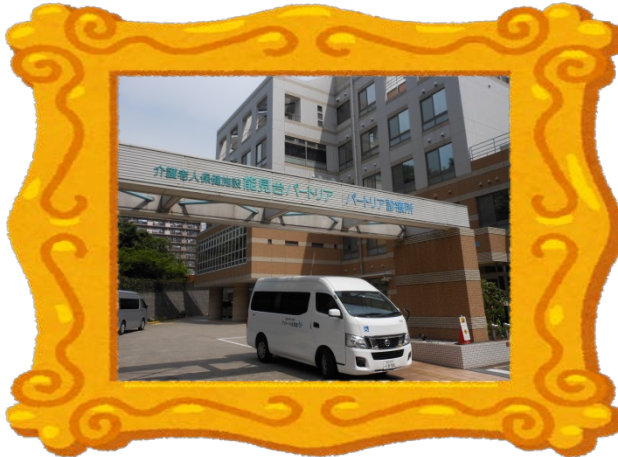
介護老人保健施設 能見台パートリア外観