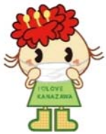
金沢区幸せお届け大使ぼたんちゃん