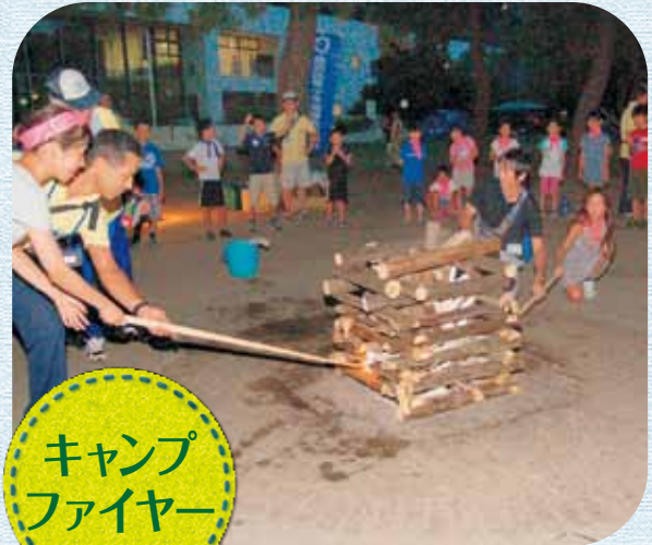
キャンプ ファイヤー

今回は募集開始初日に申込み定員に達するほどの人気ぶりで、60名の子どもたちが、青少年指導員と、看護師の方と共にイベントを楽しみました。子どもたちにとって「夏の楽しい思い出のひとつ」になったと思います。