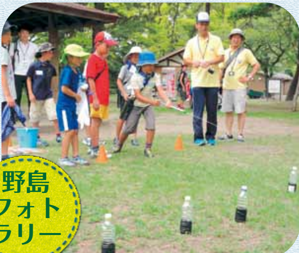
野島 フォト ラリー