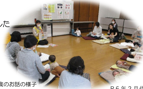
離乳食のお話の様子