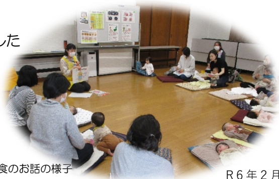
離乳食のお話の様子

【お問い合わせ】 金沢福祉保健センター こども家庭支援課 045-788-7787