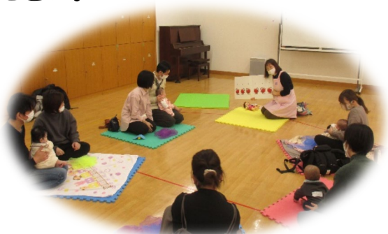
大きい絵本の読み聞かせ

また、これ以外でも状況によって危険であると判断した場合、中止することがあります。