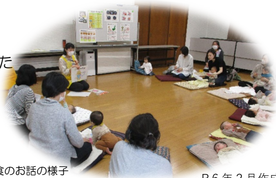
離乳食のお話の様子

【お問い合わせ】 金沢福祉保健センター こども家庭支援課 045-788-7787