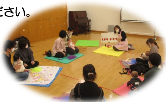
大きい絵本の読み聞かせ

また、これ以外でも状況によって危険であると判断した場合、中止することがあります。