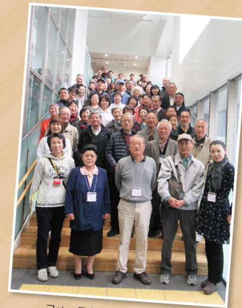
フォーラムKANAZAWA2017秋にて