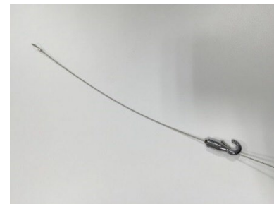
ワイヤーフック（見本）

レールフックは中央棚に 16 個、ガラス扉付き棚（鍵付き）に各 4 個付属しています