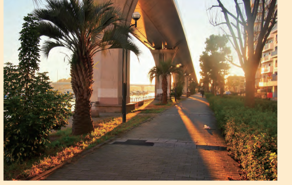
C 平潟湾プロムナード Hirakatawan Promenade