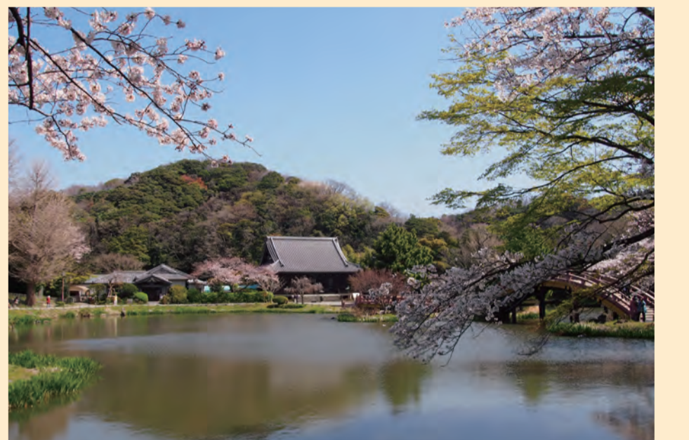
A 称名寺・県立金沢文庫 Shomyoji Temple/Kanazawa Bunko Museum