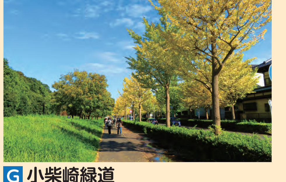
G 小柴崎緑道 Koshibazaki Green Way