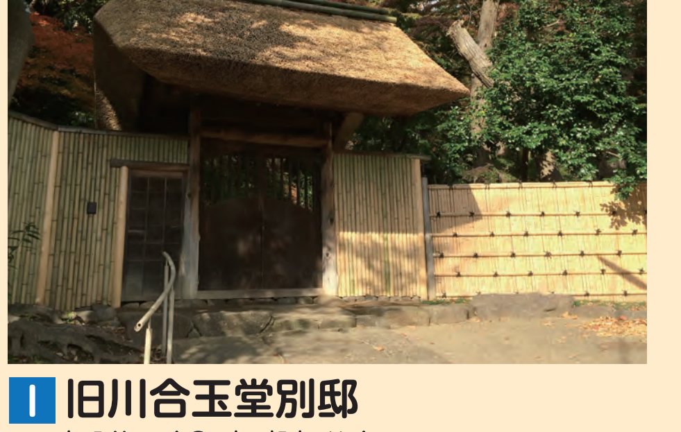
I 旧川合玉堂別邸 kyū Kawai Gyokudō bettei