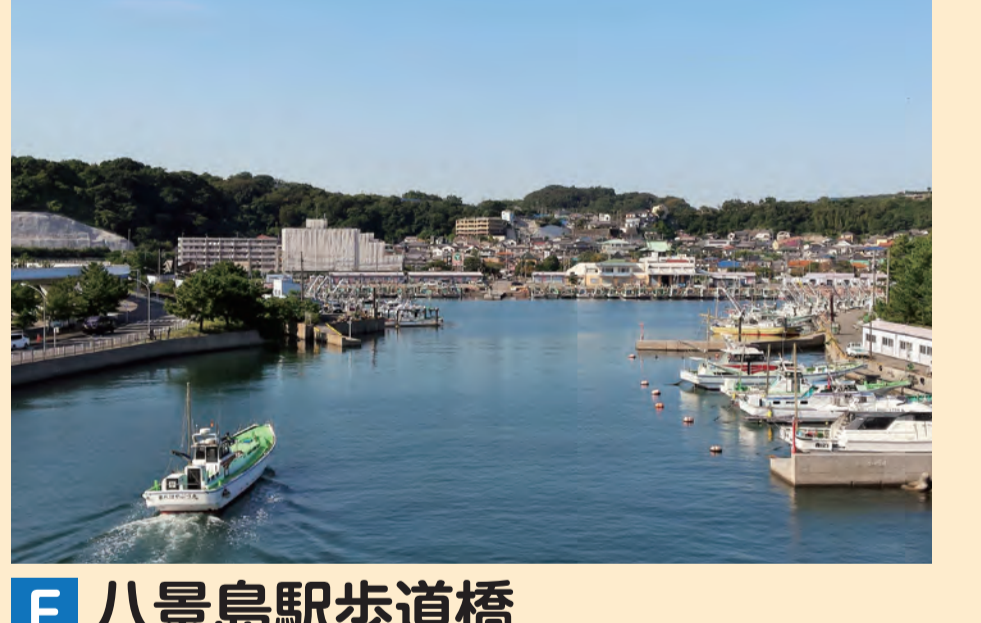
F 八景島駅歩道橋 Hakkejima Sta. Footbridge