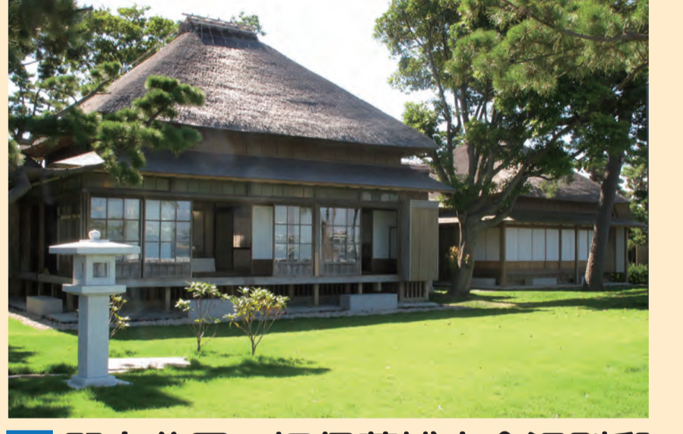
D 野島公園・旧伊藤博文金沢別邸 Nojima Park/Old house of Hirobumi Ito in Kanazawa