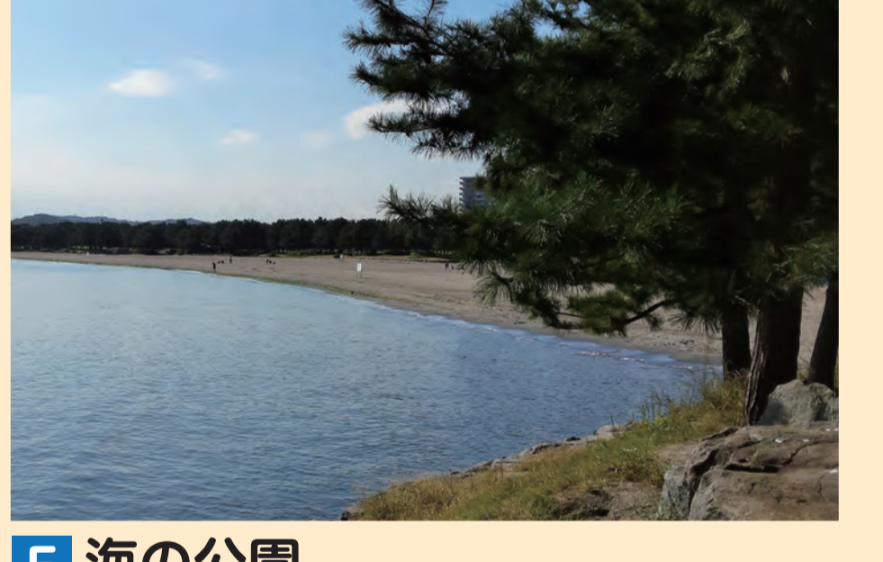
E 海の公園 Umi-no-koen (Marine Park)