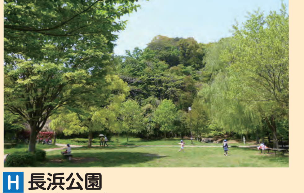
H 長浜公園 Nagahama Park