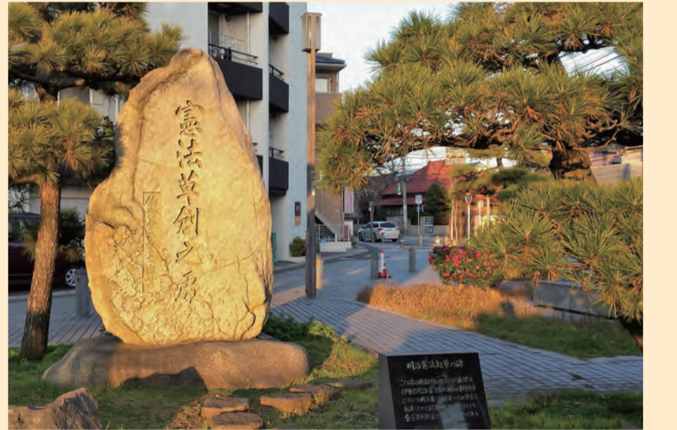
B 明治憲法草創の碑 Meiji Kenpo Soso-no-hi monument