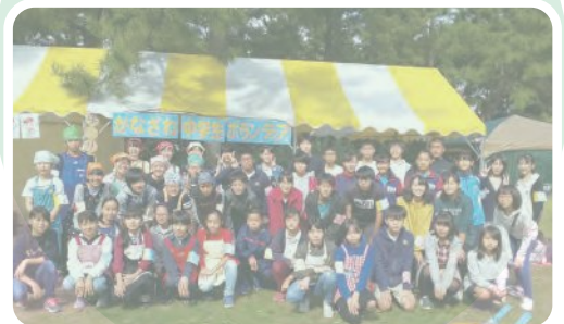
▲ 区民まつり「いきいきフェスタ」での 中学生ボランティア活動 (主任児童委員)