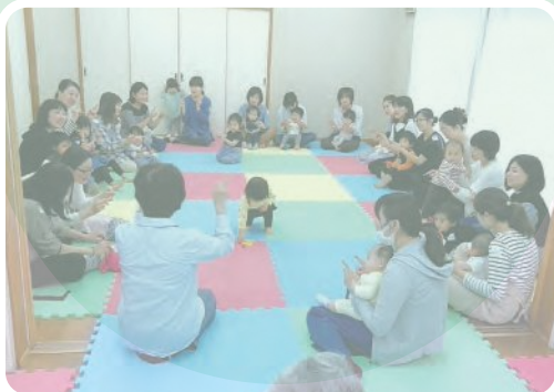
▲ 富岡第一地区 子育てサロン

養育者同士のおしゃべりや息抜き、お友達づくりや情報交換の場として、入園前の親子が自由に集える、地域のフリースペースを開いています。