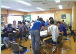
地域防災拠点向け研修