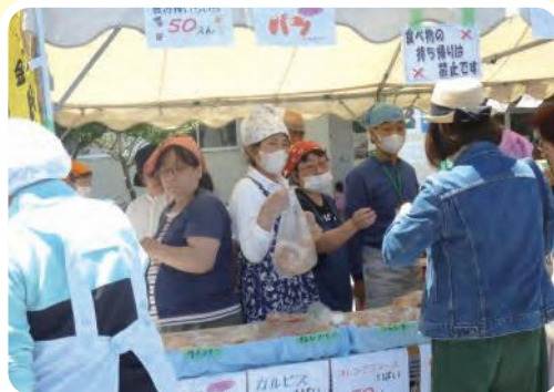
▲ 六浦西地区「フレンドまつり」出店

自治会・町内会や地区社会福祉協議会の一員として、地域のイベントなどに協力しています。