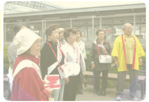
▲ 赤い羽根共同募金 街頭募金活動