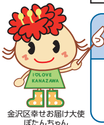
金沢区幸せお届け大使 ぼたんちゃん