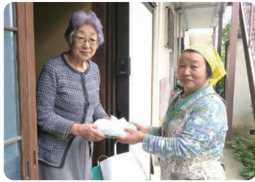
▲ 富岡第二地区 高齢者配食

ひとり暮らしの高齢者などを対象に、ご自宅までお弁当を届ける「高齢者配食」を行っている地域があります。