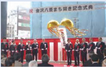
金沢八景まち開き記念式典