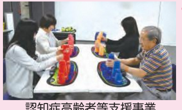
認知症高齢者等支援事業 スポーツスタッキング講座