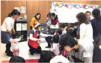
育児サークル交流会