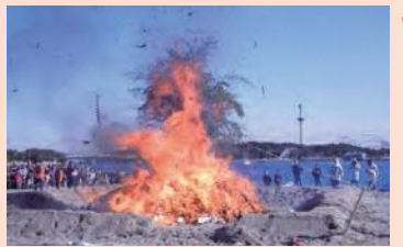
どんど焼き(海の公園)