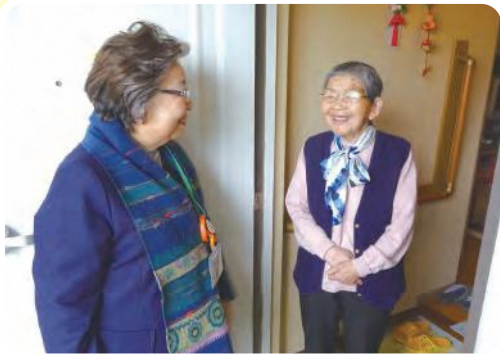
▲ 高齢者宅への訪問