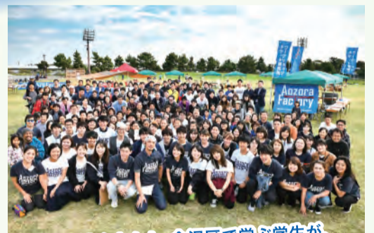
金沢区で働く人々と、金沢区で学ぶ学生が、元気いっぱいの笑顔でお待ちしています!

今年は新たに「かなざわマルシェ」も開催します。金沢区の工場や農場で作られたお菓子や野菜を、生産者の皆さんから直接買う楽しさも体験できます。