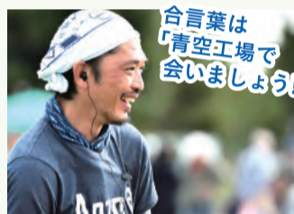
合言葉は「青空工場で会いましょう!」