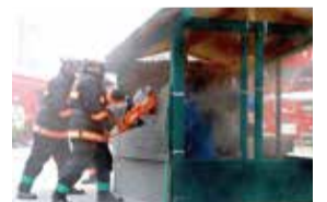
真剣に訓練に取り組んでいます!