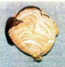
コガタスズメバチの巣 キロスズメバチの巣