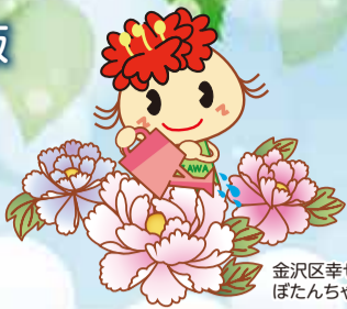
金沢区幸せお届け大使 ぼたんちゃん