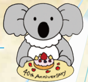
金沢図書館 マスコットキャラクター リーどくん