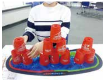
経験を問わず誰でも楽しめます

🕒6月4日(木)・16日(火)、7月2日(木)・14日(火)・28日(火)(全5回) 14時~15時30分 📍区役所1階1号会議室 📄区内在住、おおむね65歳以上/25人先着 持 飲み物、動きやすい服装 📄12個のカップを積み上げては崩し、タイムを競う、誰もが気軽に楽しめるスポーツです。動きが機敏になり、脳の活性化にも効果があると言われています。 📄5月11日(月)から☎で下記へ 📄高齢者支援担当(4階402) ☎788-7777 📠786-8872