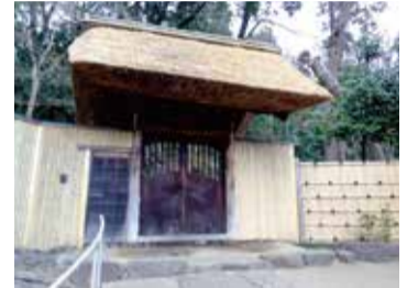
旧川合玉堂別邸表門

📍富岡東5-19-22(「京急富岡」駅東口徒歩2分) 📄企画調整係(6階602) ☎788-7729 📠786-4887 ※当日連絡先:旧川合玉堂別邸 ☎080-1241-0910