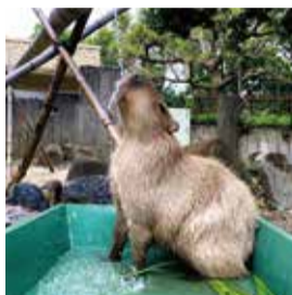
打たせ湯と菖蒲湯でリラックス♪