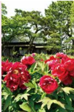
旧伊藤博文金沢別邸の牡丹

高さ:1~3m 花の色:赤、白、紫、黄色、ピンクなど 見られる場所:旧伊藤博文金沢別邸(野島町24)、龍華寺(洲崎町9-31)、泥亀公園(区役所隣接)など