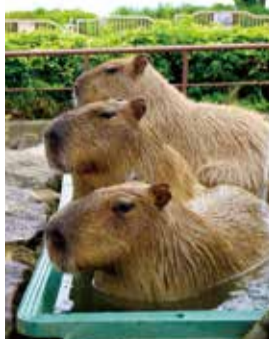
のんびりお湯につかるカピバラ

家で過ごす時間が見直される機会にもなった今年、皆さんもご自宅でゆっくりお湯につかり、カピバラたちのようにリラックスしてみたいかがでしょうか。金沢動物園へご来園の際には、のんびりお湯につかるカピバラたちにぜひ会いに来てください。