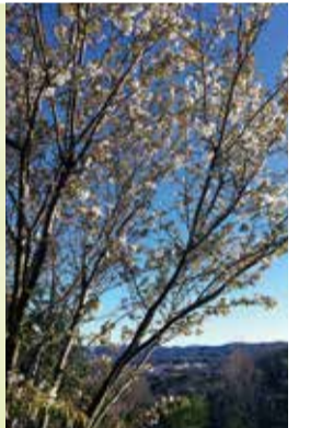
金沢自然公園の山桜

高さ:15~20m 花の色:白、薄ピンク 見られる場所: 釜利谷などの円海山山系、 金沢自然公園(釜利谷東5-15-1)など