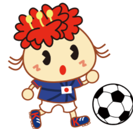
金沢区幸せお届け大使 ぼたんちゃん

2016年より帝京平成大学女子サッカー部監督に就任し、指導に力を入れている。その傍ら女子サッカー解説者としてテレビ出演も行っている。