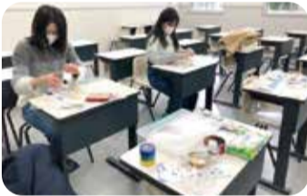
おもちゃを鋭意作成中!

私たちは、横浜市大附属病院に入院している子どもたちを支えるボランティア活動を平成19年より行っています。活動14年目の令和2年度は、手作りのおもちゃ2種類を届ける活動を計画しました。