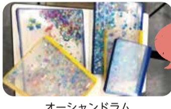
オーシャンドラム