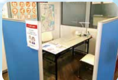
相談ブースにアクリル板を設置するなど 感染症対策を行っています。

☎ 金沢区生きがい就労支援スポット(泥亀1-21-5 いきいきセンター金沢1階) ☎ 370-8356 ☎ 370-8379 生きがい就労支援スポット 検索