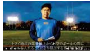
ラグビールール教室