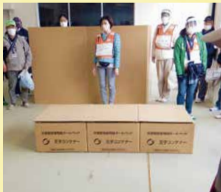
ダンボールベッド組立