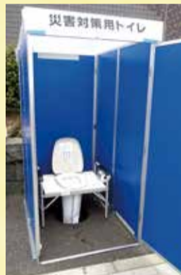
仮設トイレの設置