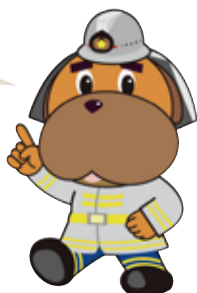
横浜市消防局 マスコットキャラクター ハマくん