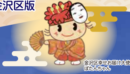
金沢区幸せお届け大使 ぼたんちゃん