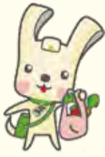
横浜市資源循環局マスコット イーオ

集まった食品はフードバンクなどを通じて、区内の子ども食堂や、必要な人へ無償でお渡ししています。