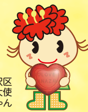
金沢区 幸せお届け大使 ぼたんちゃん