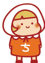
横浜市地域福祉保健計画キャラクター