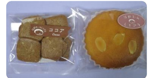
↓ 第3しもごう p.17