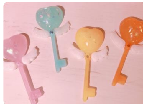
↑ アトリエ窓 p.6