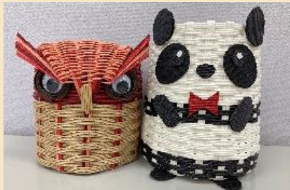
クラフト製のペン立て

とつかわかばは、横浜市全区に1か所ずつ設置されている中途障害者地域活動センター(中活)の1つです。