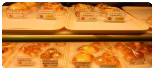
↑ であい p.18