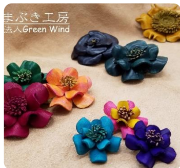
↓ やまぶき工房 p.10