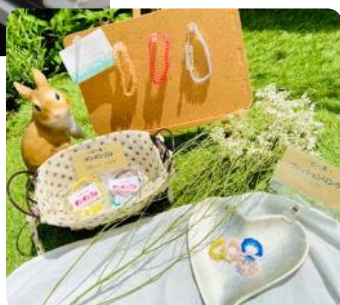
↑ クローバー(Begin) p.11