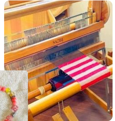
↑ いとぐるま p.13