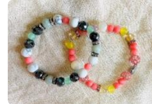
クローバー(深谷) ↓ p.12