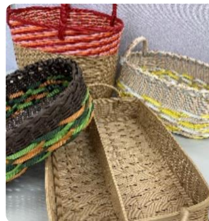
↑ とつかわかば p.9