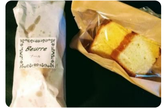
↑ りんごの木 p.19