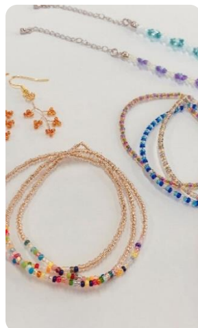
↑ しもごう p.15